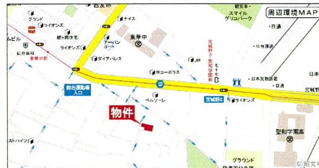
カーナビ表示:宮城県仙台市若林区木ノ下2丁目13-13